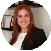
Adriana González Mercer Colombia LTDA

La Junta Directiva de la Fundación está compuesta por 10 voluntarios de las empresas afiliadas y aliados estratégicos de la Fundación. Los cuales brindan su tiempo y conocimiento para el fortalecimiento de la organización, la realización de proyectos de inversión social con mayor impacto y la posibilidad de construir una mejor Colombia a través de las alianzas.